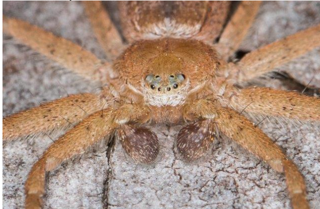
de zeer zeldzame schorsrenspinn