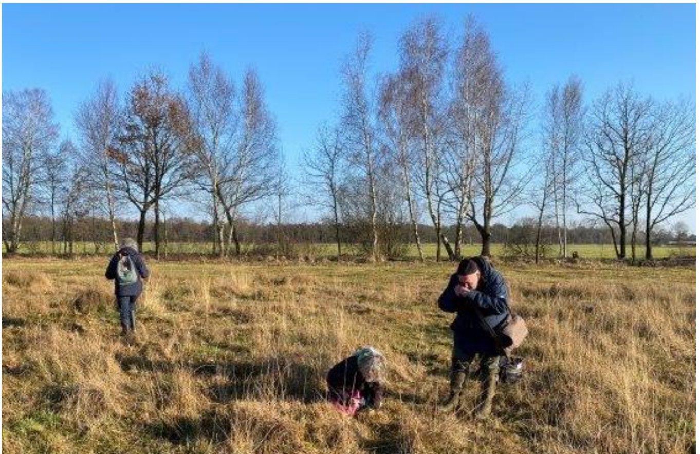
Een gezellige bende op pad !!!