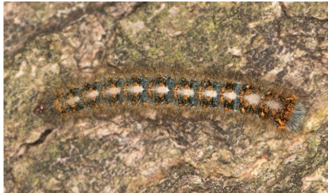
Rups van de Hageheld